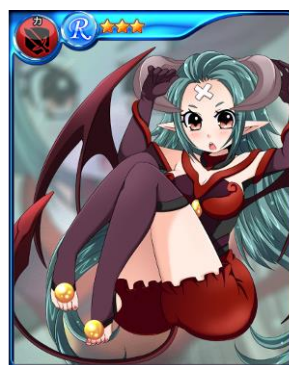
レッサーデーモン