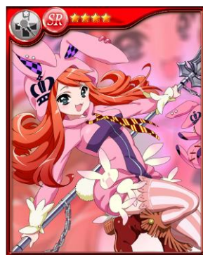
ジャイアントバニー