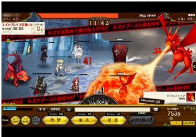
▲「絆ノ塔」に巣食う「邪神」に挑め！ 仲間と共に、大型ボスやライバルと対戦！