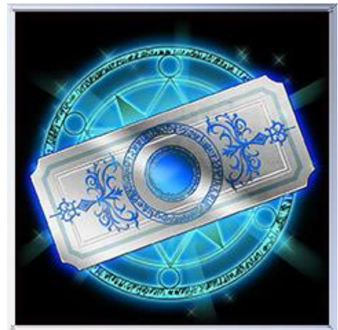
R以上確定ガチャチケット×20枚