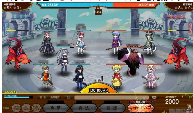
▲最大10人 vs 10人のギルドバトルが熱い