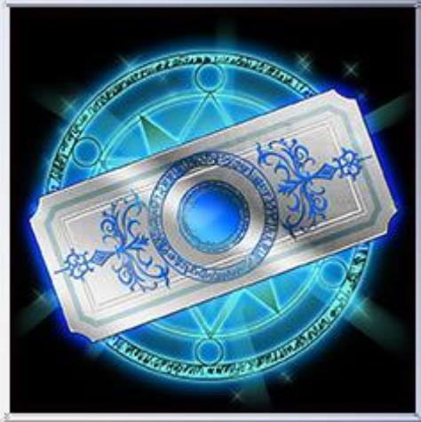
R以上確定ガチャチケット×20枚