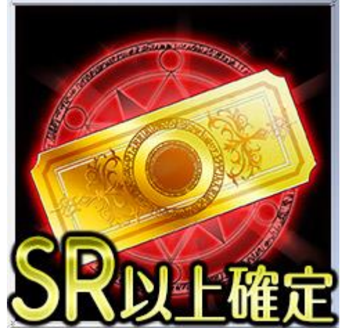
SR以上確定ガチャチケット