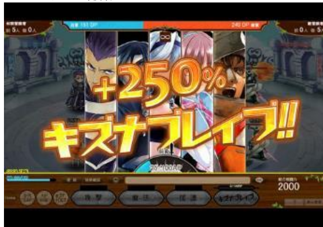
▲バトルの鍵は「キズナ」！ 仲間と力を合わせて「キズナブレイブ」を発動しよう！