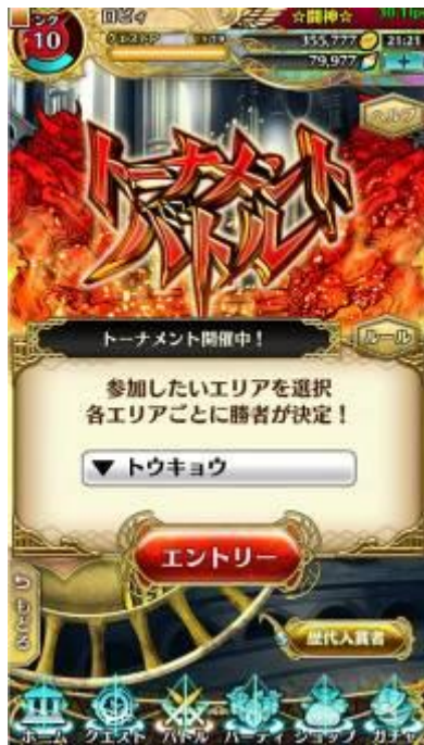
▲PVP はもちろん、トーナメント大会機能やランキング制度など、充実のバトルシステムを用意！