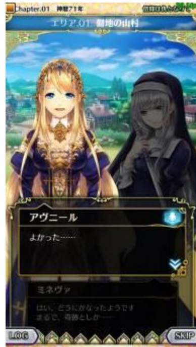
▲バトルだけじゃない！11人の巫女をめぐるストーリーモードもやり応え満点！