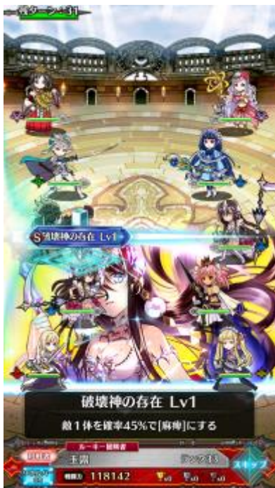
▲奥深いのにお手軽！？ 練りに練ったデッキで全国のライバルとサクサクバトル！

お家ではじっくりとデッキを練り、お出かけ先や移動中のちょっとした隙間時間にバトルを楽しむなど、みなさんの生活スタイルに合わせて是非プレイしてください！