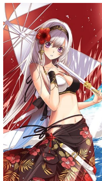
ログインボーナス「アイギナ」

「アイギナ」はイベント特攻ボーナスを持っていますので、大活躍させることが可能です。