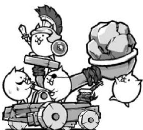
▲ 帝国陸軍カタパルズ