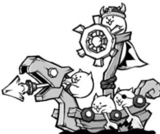
▲ 古代軍船ガレーズ