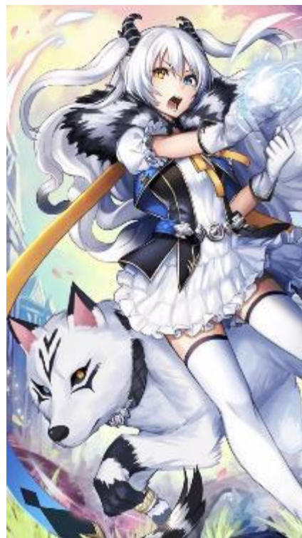
【叡智感興の竜帝】リティル (CV:水橋かおりさん、イラスト:kgr さん)

◆「アルティールエヴォリューションガチャ」に関する詳細 URL https://www.alchro.jp/news/180420-01/