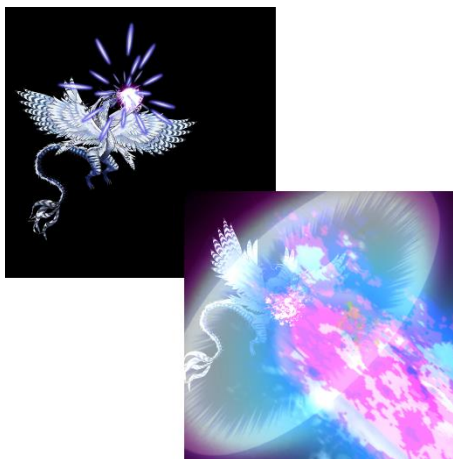
竜に姿を変えてバトルを展開することが可能

10 連ガチャに限り、「特別枠」にて UR 以上のキャラまたはアクセサリが 1 個確定します。