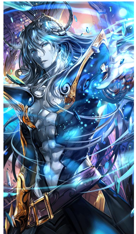
「【傲慢の七獄魔】ルシフェル」