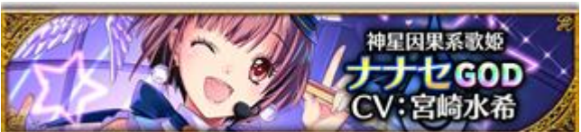
【最終因果系歌姫】ナナセ (CV: 宮崎水希さん、イラスト: ほぼるちゃさん)