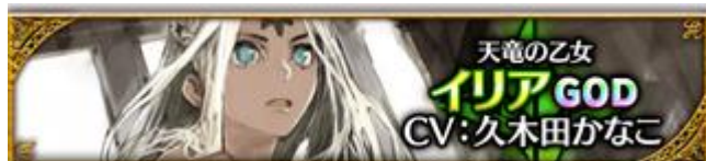
【天竜の乙女】イリア (CV: 久木田かなこさん、イラスト: toi8 さん)