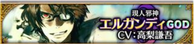
【現人邪神】エルガンディ (CV: 高梨謙吾さん、イラスト: toi8 さん)