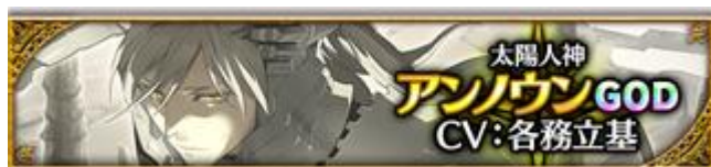
【太陽人神】アンノウ (CV: 各務立基さん、イラスト: 結川カズノさん)