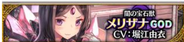
【闇の宝石獣】メリザナ (CV: 堀江由衣さん、イラスト: saraki さん)