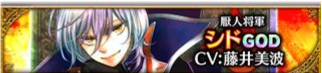
【厭人将校】シド (CV: 藤井美波さん、イラスト: Dite さん)