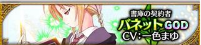
【書庫の契約者】ハネット (CV: 一色まゆさん、イラスト: 騎羅さん)