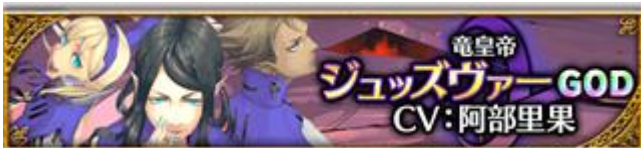
【竜皇帝】ジュッスヴァー (CV: 阿部里果さん、イラスト: 結川カズノさん)