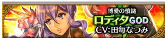
【博愛の憤鎚】ロディタ (CV: 田毎なつみさん、イラスト: 碧風羽さん)