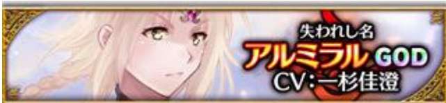
【失われし名】アルミラル (CV: 一杉佳澄さん、イラスト: 米月かなさん)