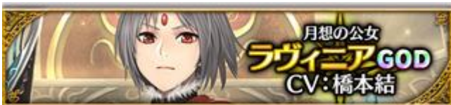
【月想の公女】ラヴィニア (CV: 橋本結さん、イラスト: KASEN さん)