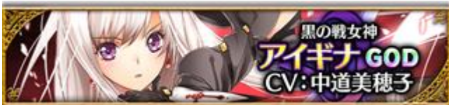
【黒の戦乙女】アイギナ (CV: 中道美穂子さん、イラスト: ほぼろちゃん)