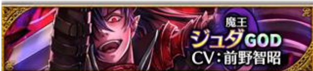
【魔王】シュダ (CV: 前野智昭さん)