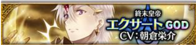
【終末皇帝】エクサート (CV: 朝倉栄介さん、イラスト: 米月かなさん)