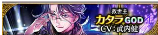
【救世主】カタラ (CV: 武内健さん)