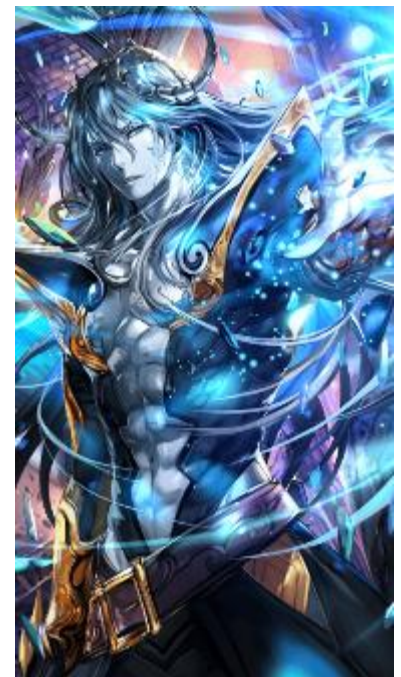
【「傲慢の七獄魔」ルシフェル