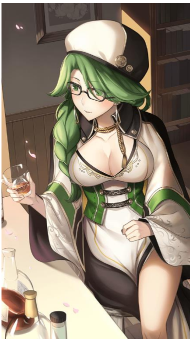
【「寛大なる司書」オプセア