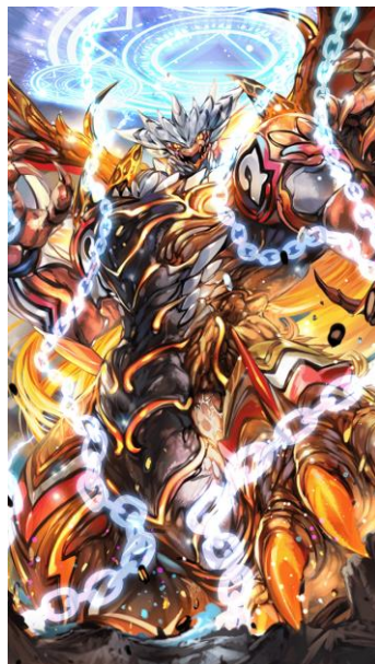
「【千古の暴炎帝】ムルキベル」 (CV：中島卓也さん、イラスト：旗助さん)